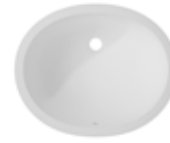
Calm 815 520x367x158 mm