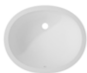
Calm 810 418x332x138 mm