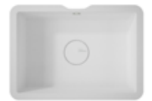
Energy 7720 490x310x130 mm