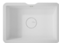
Energy 7710 440x300x120 mm