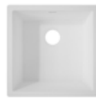
Spicy 965 400x400x176 mm