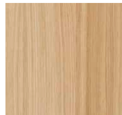
Untreated Natural Oak