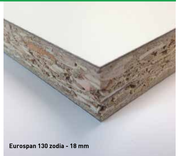
Eurospan 130 zodia - 18 mm